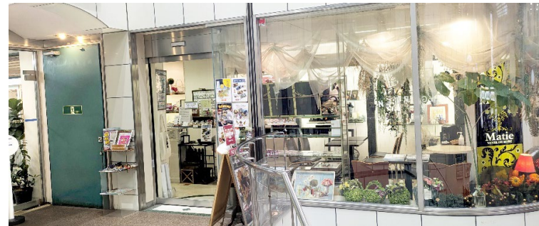
ガラス張りの明るい店内、歩行者からの視認良好です。