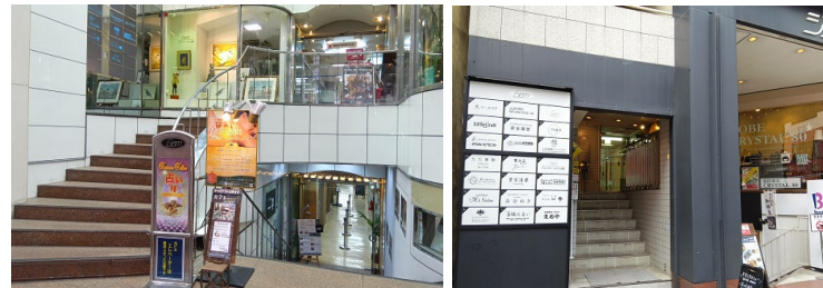
↑ビル北入口、元町商店街側。緩やかな階段を上ります ↑ビル南入口 南京町に面しています